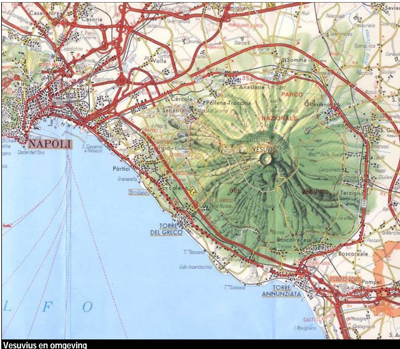
Vesuvius en omgeving