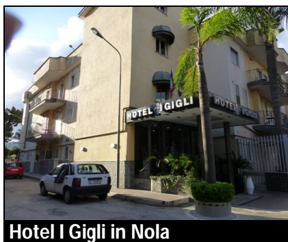
Hotel I Gigli in Nola