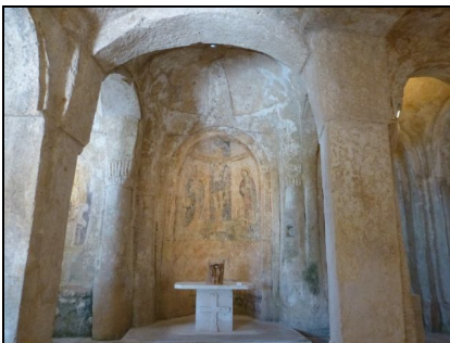
S. Nicola dei Greci

Tegen tien uur waren we in Matera, gelegen op de rand van een diep ravijn. Natuurlijk eerst een kopje koffie en daarna is een gedeelte van de groep met Irmina via een lange trap afgedaald om door de straatjes te wandelen en de grotwoningen te bekijken. Eerst bezochten we de volledig ingerichte Casa Grotta waar een Engelse geluidsband werd afgespeeld met het verhaal hoe de mensen vroeger in deze huisjes leefden. We hadden geluk dat de verderop