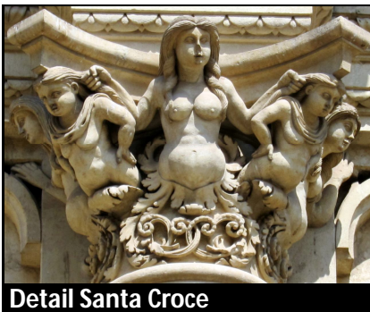
Detail Santa Croce

amfitheater en door de leuke straatjes naar de Santa Croce en de Dom. Op het Domplein hebben we de mooie bronzen deuren uitgebreid bekeken en daarna hadden we vrij om te lunchen. Daarna om half twee gezamenlijk naar de bus gelopen, waarna naar Otranto gereden. Bergop om naar de kathedraal te lopen. Omdat