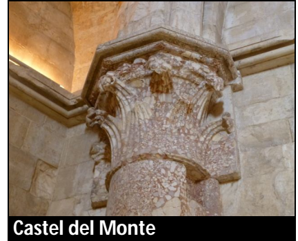
Castel del Monte