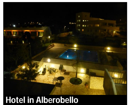
Hotel in Alberobello

met frites en worteltjes en een ananastoetje met rode saus. Lekkere wijn erbij, zelfs twee glazen, aangeboden door de Vereniging van de Vrienden. Helaas kwam het tweede glas pas na lang aandringen van onze reisleider Ton. Aan het gekwebbel te horen was het een heel gezellige avond.