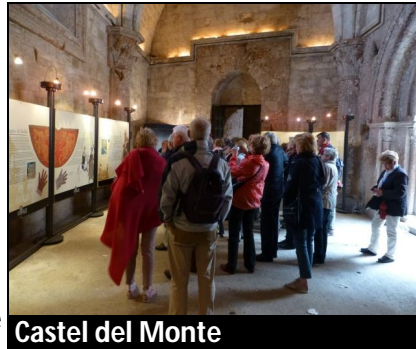
Castel del Monte