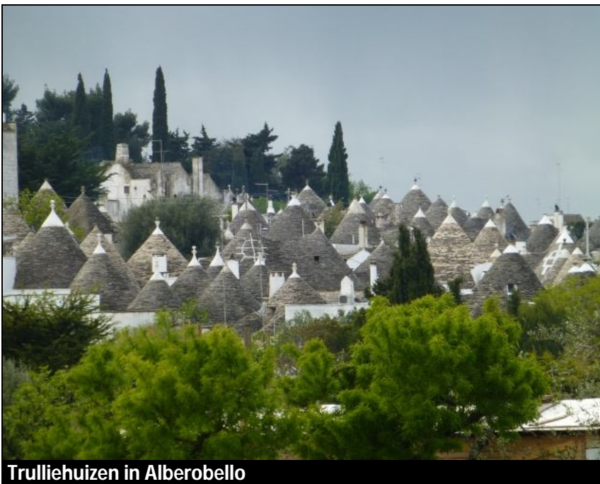
Trulliehuizen in Alberobello

Helaas weer wat regen. Ieder kon op eigen gelegenheid de stad inlopen om de Trulliehuizen te gaan bekijken. Vanavond hebben we gegeten aan tafels met zes personen, de sfeer was weer zeer geanimeerd en het menu bestond uit twee pasta voorgerechtjes, een lekker varkenslapje met champignons of gevulde aubergine en ijs met vruchten toe. Weer een prima dag!