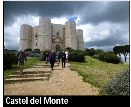
Castel del Monte

Deze dag begon met een uitgebreid ontbijt, met allerlei zoetigheden. De bus vertrok om half negen om naar Castel del Monte te gaan. Irmina heeft veel verteld over de geschiedenis van Zuid-Italië en over Frederic II. Onderweg regelmatig regen maar soms ook zon. Bij het uitstappen regende het wel en er stond een koude wind. We kregen allemaal een kastje met een "oortje" zodat we Irmina overal goed konden horen en zij niet hoefde te schreeuwen. Het achthoekige kasteel was zeer de moeite waard om te bezoeken. Om er te komen werden we er met een shuttlebus heengebracht. Daarna doorgereden naar het havenstadje Trani, waar we twee uur vrij te besteden hadden. Maar eerst een gelegenheid zoeken om iets te eten want het was al twee uur