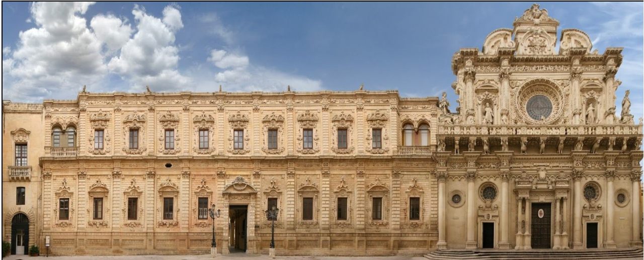
Santa Croce te Lecce

Vandaag hebben we een lange reisdag gehad. Vertrek om half negen naar Lecce, de barokstad van Italië. Na de koffie hebben we een stadswandeling gemaakt, eerst naar het