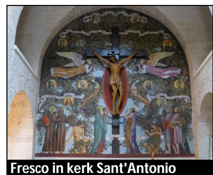
Fresco in kerk Sant'Antonio