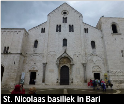
St. Nicolaas basiliek in Bari

Om half negen vertrek naar Bari, een tocht van anderhalf uur. Het was zelfs zonnig toen we