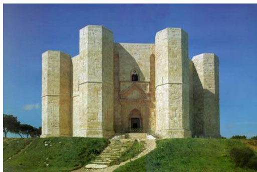
Castel del Monte bij Ruvo di Puglia